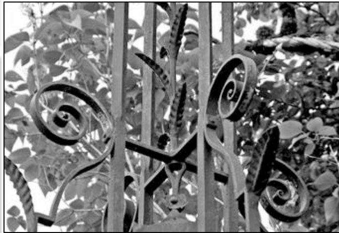
partie haute tige avec feuilles alternées terminée par une fleur fleur de lys pendante