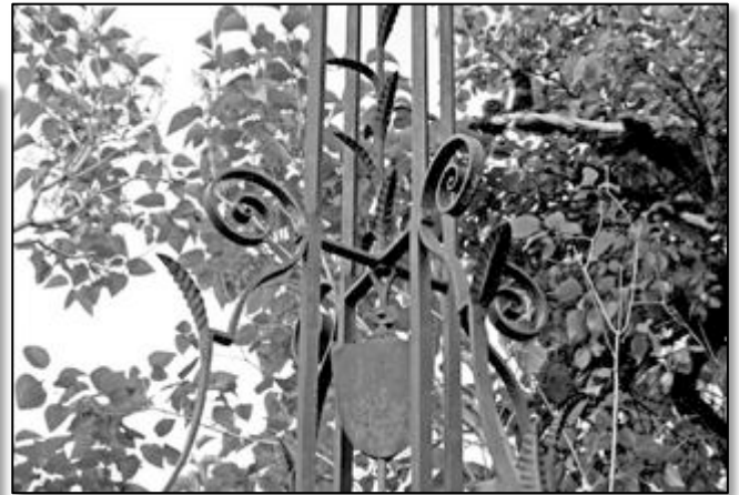
partie basse mitre et crosse épiscopales bouclier de la foi