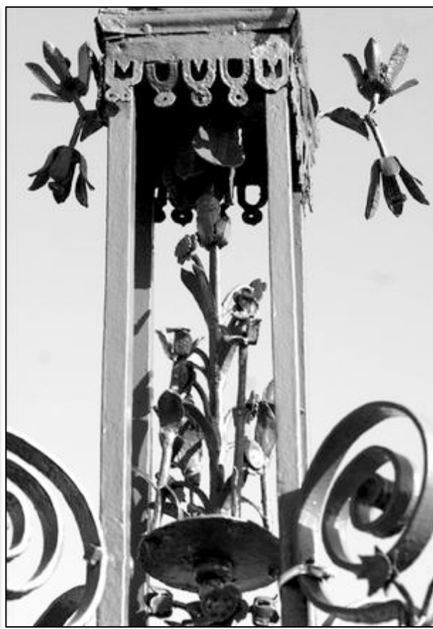
partie haute tige fleurie fleur de lys susoendue