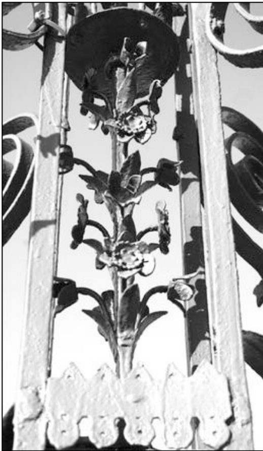
partie basse tige fleurie petit lambrequin

puissants rouleaux, feuilles d'eau et trio de fleurettes