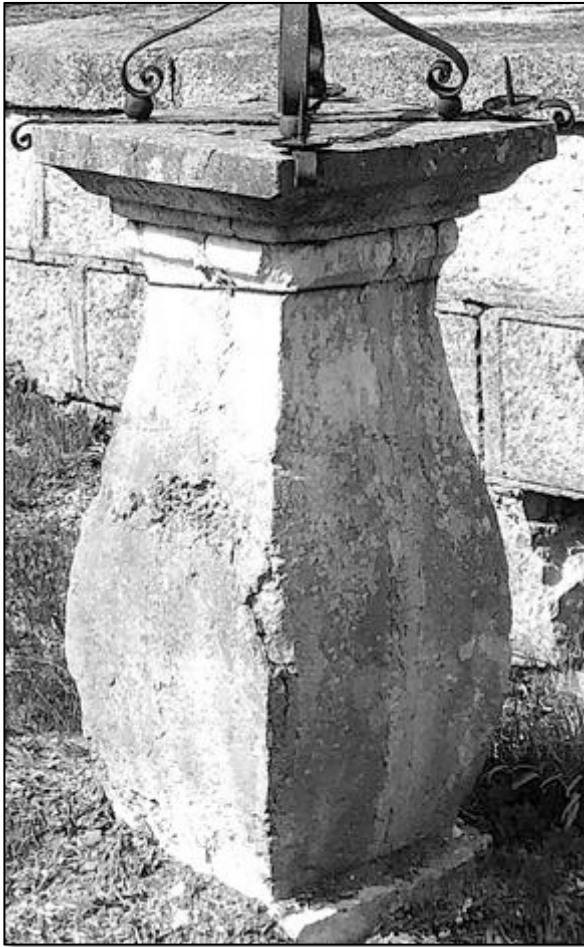
piédestal à dé galbé