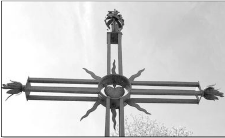
croix sommitale dépouillée cylindre (divin) au centre flammes ondulantes cœur transpercé