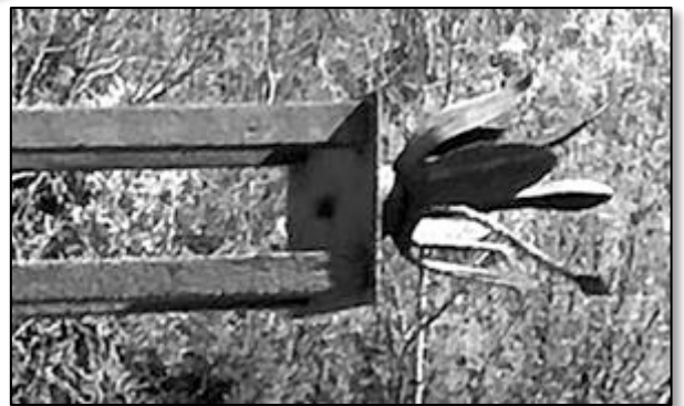
lys à graine élancée fixé sur perle