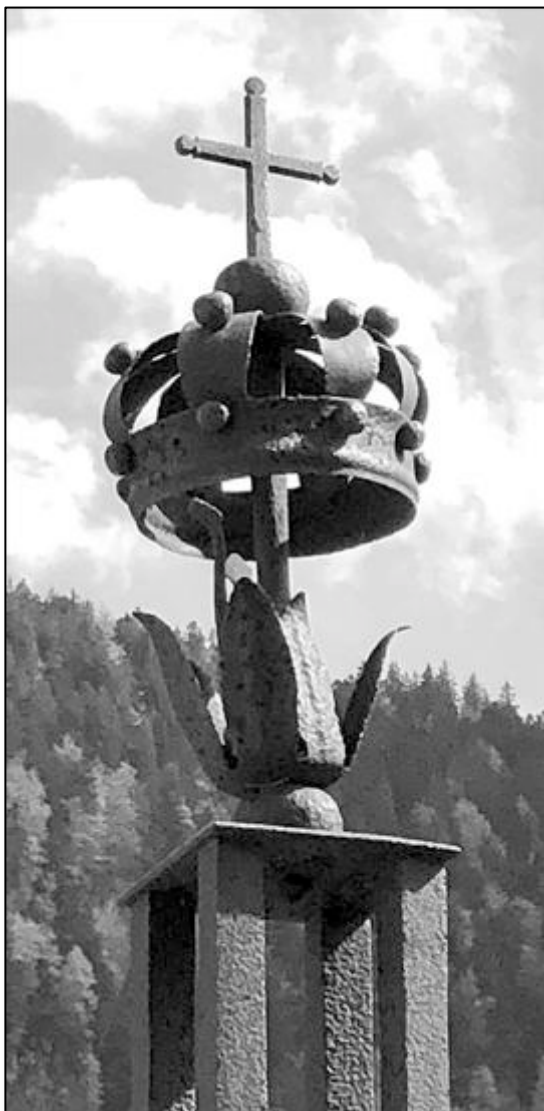
lys sommital avec couronne et croix