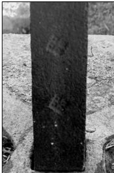
marques en carreaux ou losanges