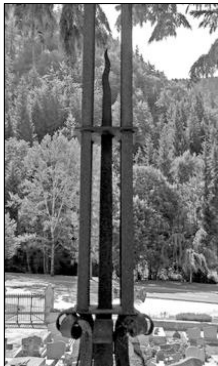
fer central vertical à flamme ondulante